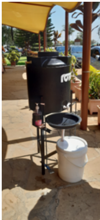
Handtvättställe vid en av restaurangerna i stan. Det finns trampor både för att få vatten och tvål. Det är inget fel på uppfinningsrikedomen.