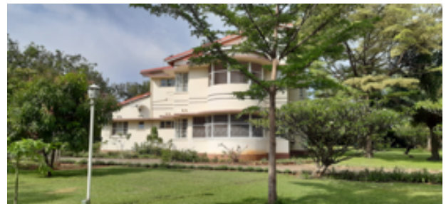
Här bor jag... Men inte i hela huset.