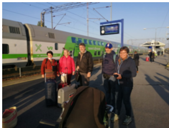
I Seinärjoki, första etappen till Kenya ska snart påbörjas.

Det roligaste var ändå att komma till kyrkan här i Kisumu. Gudstjänsten hölls ute. Stolarna var placerade med något sorts avstånd emellan och ingen hälsade. Även om så mycket var