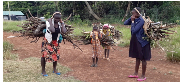
Flickor som bär ved

Kom gärna med i min stödring! Läs mera på http://www.slef.fi/stodring