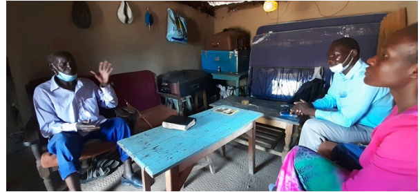
Hembesök hos en gammal man