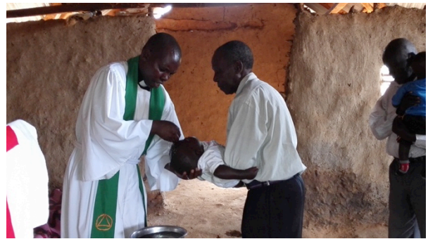
En av prästens många uppgifter