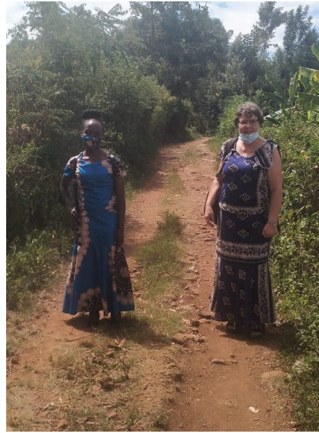
Min diakonistuderande och jag på väg på hembesök