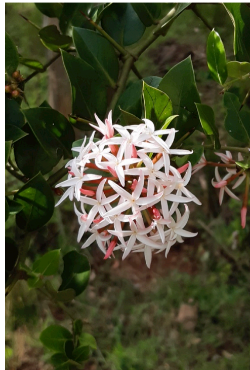
Naturen är otrolig rik. Här en blomma som jag såg för en tid sen.