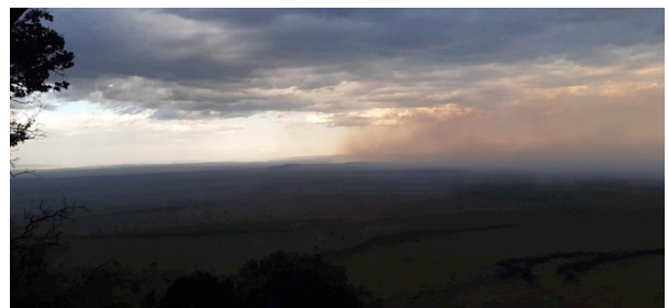
Regn över Masai Mara